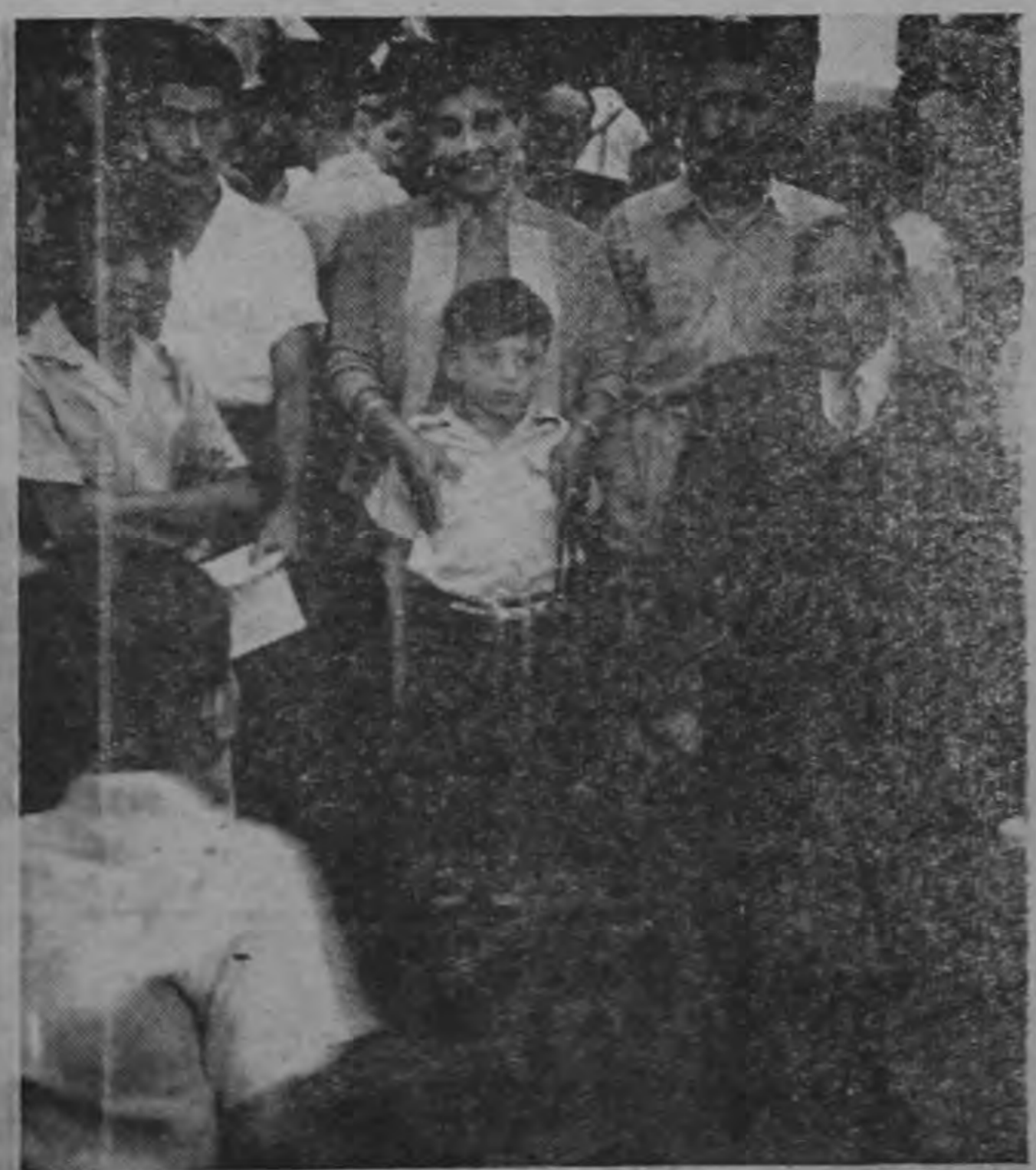
Con motivo del "Hogar Adoptivo por un día" organizado por la Asociación de Periodistas de Costa Rica el domingo próximo pasado, varias familias dieron su cooperación más decidida. En la gráfica aparece la familia Escalante y el niño adoptado por ella.

ORGANISMO (Viene de la Página PRIMERA) La creación de un régimen de Congresos del Niño Centroamericano Panamá, de los cuales el que se celebra sería el primero. El Organismo Coordinador vendría a funcionar como organismo regional del Instituto Panamericano de Protección a la Infancia, que trabaja actualmente con sede en Montevideo. La presentación de las ponencias citadas estará condicionada a determinadas condiciones, tal como la venida de la delegación guatemalteca al Congreso, la cual se espera para cualquiera de estos días.