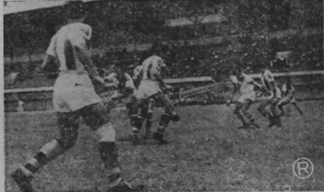
UNA ACCION CONFUSA DEL PARTIDO MORAVIA-CARTAGINES.— Gran número de jugadores de ambos equipos aparecen en esta confusa jugada del duelo entre reclutas y brumosos. El partido en general resultó movido y parejo de acciones. Se impuso el cuadro que supo aprovechar mejor las oportunidades.

Ya pueden ir los ciclistas hacer su entrenamiento a la carretera citada y apreciar las vistas panorámicas que ofrece dicha carretera.