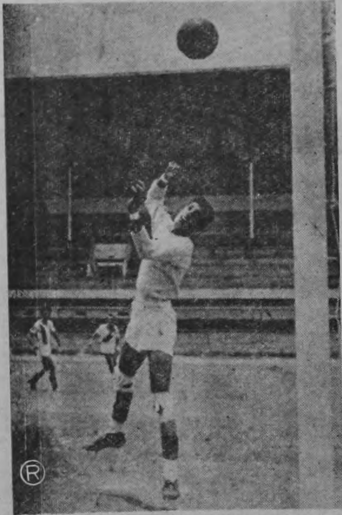
EL GOL MAS SORPRESIVO DEL DOMINGO.— Esta magnífica gráfica de SOLANO registra el preciso momento en que la pelota impulsada desde larga distancia por el puntero izquierdo moraviano Lobo, sorprende al arquero Meneses que no atina a intervenir. El cuero dará en el poste derecho y seguirá rumbo al fondo del arco, para convertirse en el segundo tanto recluta, que vino a decretar la definitiva derrota de los brumosos y la eliminación del torneo Phillips.

tos de juego, anidó el primer y nice tanto universitario. Los equipos alinearon así: ALAJUELENSE: Miranda; Mera, Quesada y Molina; Maes y Montanaro; Baroy II, Salas, Araya, Alvarez y Sánchez. (Después: Urbina, Ugalde y Chacón) UNIVERSIDAD: Alfaro; Tejero, Corcero y Leovigildo; Roldán y Salas; E. Chavarría, G. Chavarría, Speletta, Agüero y H. Checo. (Después Coto y Solano) Buen arbitraje de Alvar M.