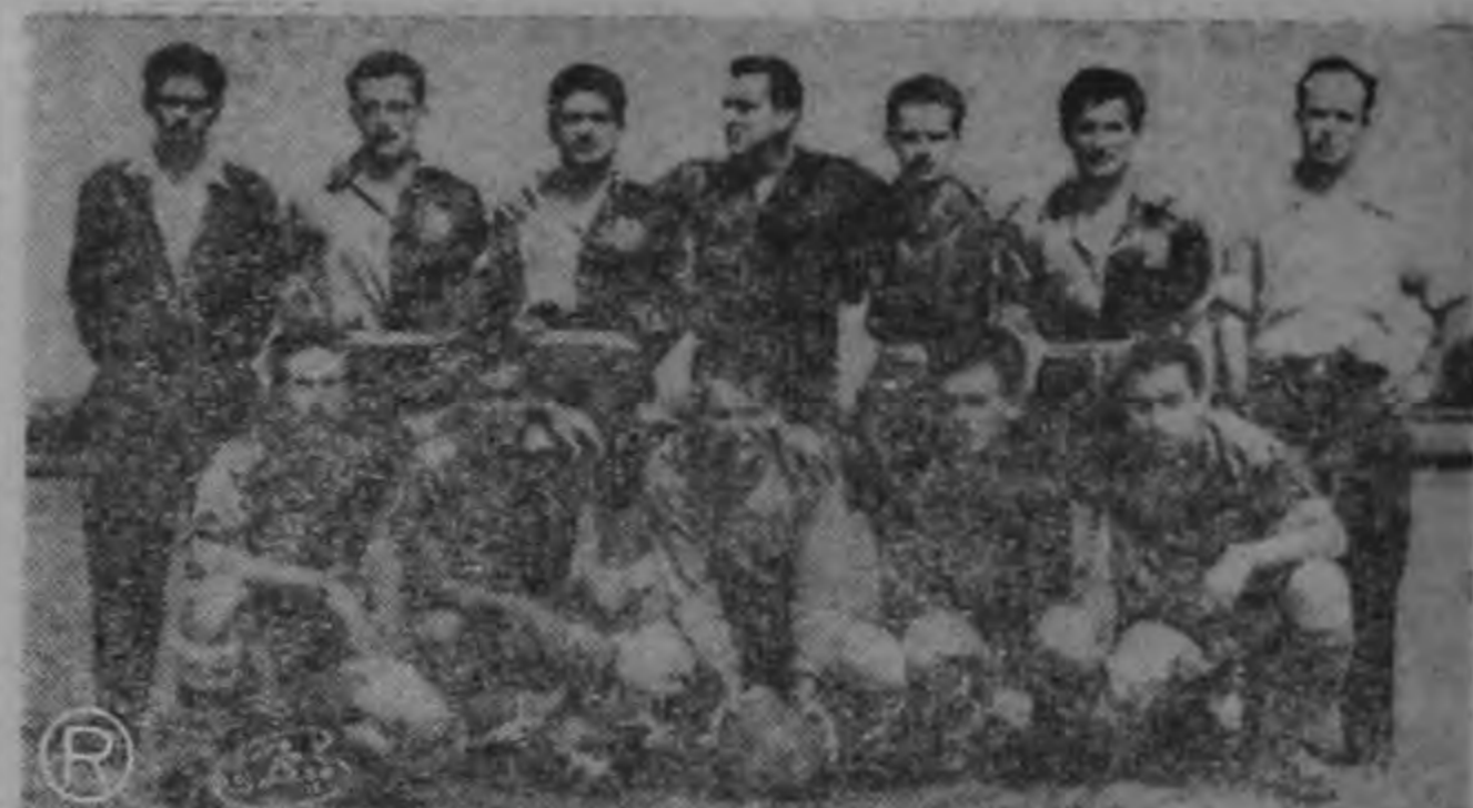
El equipo del Barrio GÜELL se impuso el domingo al SAN DIMAS por 4 a 1. Sin embargo todavía no ha logrado clasificarse para la segunda vuelta. Depende de sus futuros encuentros.