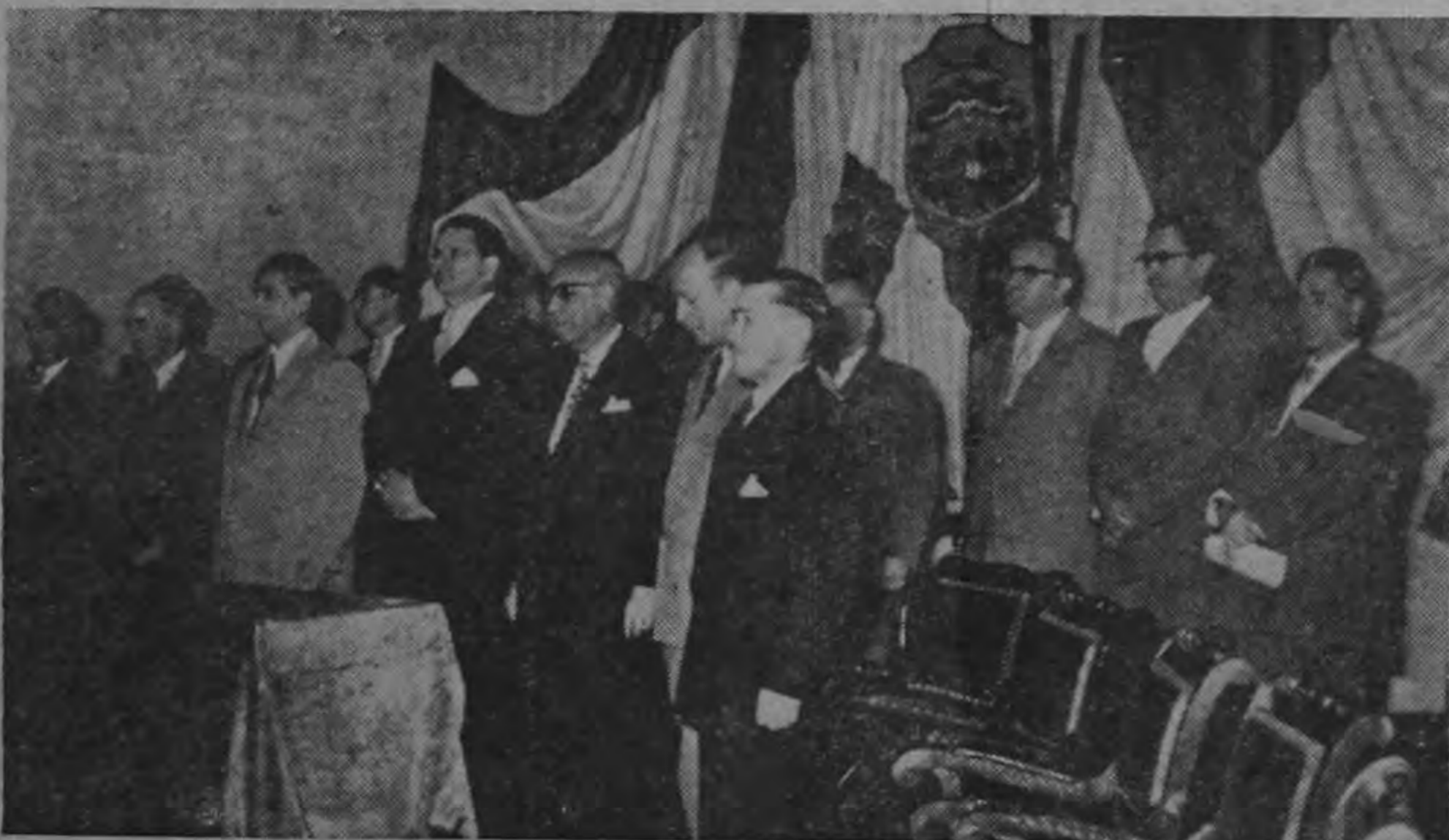
INAUGURACION DEL CONGRESO DEL NIÑO.—El domingo a las diez de la mañana, en el Teatro Nacional, quedó inaugurado el Congreso del Niño, al cual han venido delegados de muchos países. La gráfica recoge parte del grupo de distinguidas personalidades que participaron en el evento.

Nuestro colega La Prensa Libre publica en su edición de ayer una gacetilla en la que da cuenta de que existe malestar entre los empleados judiciales porque, según la nota, el Ministro don Jorge Rossi —Pasa a la Página 18—