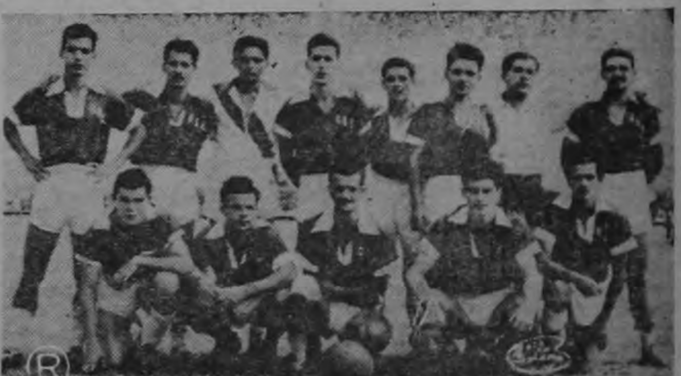
Aquí están los muchachos del equipo de LA URUCA que el domingo empataron a un tanto con el CRISTO REY, resultado que automáticamente los clasifica para la segunda vuelta.