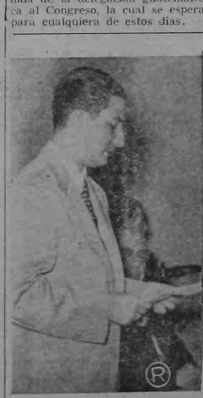
MINISTRO DE SALUBRIDAD PRONUNCIA DISCURSO.— El Dr. Loris, Ministro de Salubridad Pública, cuando pronuncia su discurso con motivo de la inauguración del Congreso Centroamericano del Niño que quedó oficialmente inaugurado el domingo en horas de la mañana