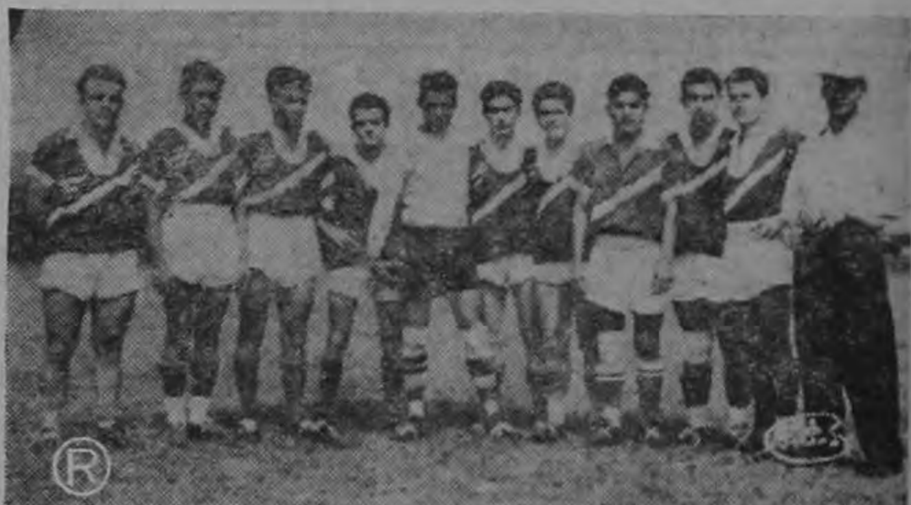
Este es el equipo representativo del Barrio Cuba que ya logró clasificarse para segunda vuelta. El domingo goleó cinco a uno al CUESTA DE MORAS dominando casi siempre.