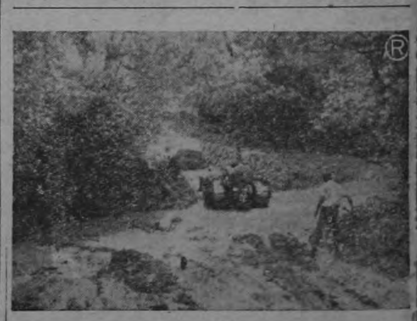
Usted puede pasar por este lugar del camino entre Lieria y Santa Cruz en unos pocos minutos, si Dios quiere, a caballo o a pie. Pero en automóvil (jeep) puede quedarse indefinidamente, si no aparece por ahí algún tractor... y hasta este peligro. Así han sido los caminos de Guanacaste. Así serán hasta pronto. Porque en un término de seis meses, habrá carretera entre poblaciones tan hermosas y promisorias, como Liberia, Filadelfia y Santa Cruz. El progreso tiene que entrar a Guanacaste por el bien de toda Costa Rica.