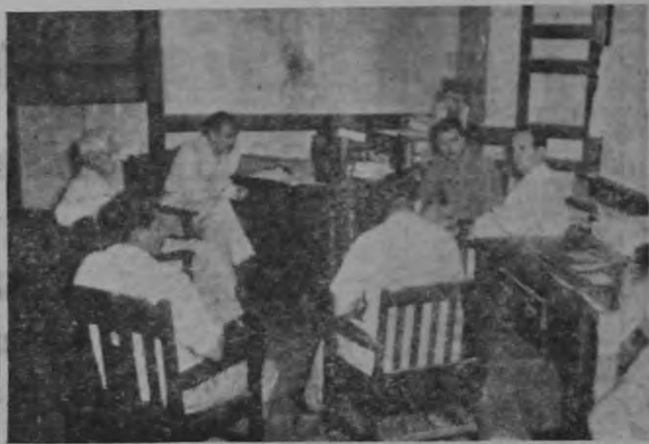
Sesión extraordinaria de la Municipalidad de Liberia con el señor Presidente de la República. Quedaron resueltos varios asuntos de importancia local, de los cuales hizo exposición en el mismo acto el gobernador de la provincia, quien acompañó al señor Figueres en su viaje hasta Santa Cruz y Filadelfia.

Rica se podrá adaptar lo que se aplica en México al respecto. Es decir que de las experiencias de muestreo estadístico que en aquel país se verifican se tendrá en cuenta al Departamento del ramo de Costa Rica, para mejorar o modernizar nuestros sistemas.