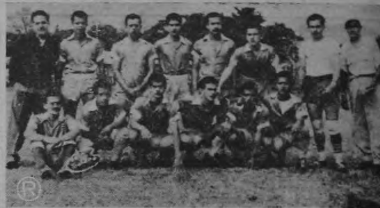
El cuadro del Barrio CRISTO REY logró un meritorio empate a un tanto frente al fuerte equipo de LA URUCA. Tienen muchas posibilidades de clasificarse para segunda vuelta.

Están clasificados para segunda vuelta: Iglesias Flores, La California, Cuba, F. C. La Uruca, Matarredonda, Santa Lucía.