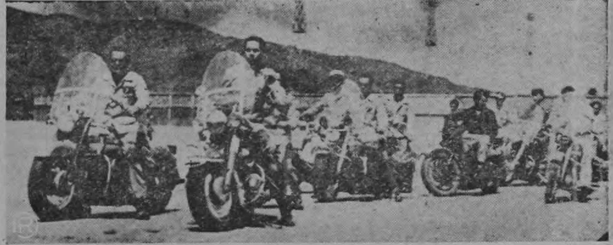
EL MOTO CLUB EN PLENA ACCION.— Esta estupenda gráfica de SOLANO nos muestra a los integrantes del MOTO CLUB de Costa Rica realizando uno de sus impresionantes desfiles de práctica en La Sabana. Es una institución deportiva de reciente fundación, pero que ha ganado rápidamente respeto y admiración general por su magnífica organización y constante progreso. Siempre están prestos a colaborar con cualquiera otra entidad que requiera sus servicios y lo hacen desinteresadamente. Vaya nuestra felicitación para el MOTO CLUB de Costa Rica.

Recuerden que el día 15 del corriente mes de agosto, los costarricenses celebramos y festejamos el DIA SAGRADO DE LA MADRE, piensen que el MAYOR y el más COSTOSO regalo que cada uno de ustedes le puede ofrecer a su idolatrada y santísima madre, es ennoblecerla con la más correcta manera de pro-